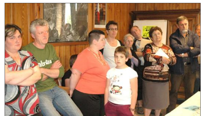
■ Une partie des nouveaux villageois.

d'atouts ». Auxquels il faut ajouter un tissu associatif important. Pour l'occasion, chacune des associations a donné un éclairage sur ce qu'elle pouvait proposer dans son domaine. Bon nombre des nouveaux viennent des zones urbaines de Montbéliard ou Belfort et malgré les 51 € en moyenne du m 2 , ces nouveaux Royoulots peuvent accéder à leur rêve de propriétaire tout en appréciant le calme des 50 ha de la zone des étangs. Tous sont invités « à participer d'une façon ou d'une autre à la vie du village ».