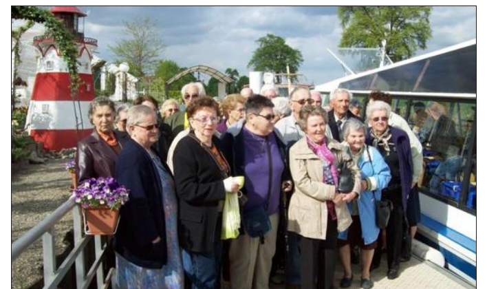
■ Petite halte appréciée au bord de l'eau.

C'est par une belle journée de printemps que trente-cinq aînés du club local se sont fait une petite sortie en bus et en bateau, rien que cela. Le bus pour rejoindre La Bresse et une confiserie fort accueillante et le port de plaisance de Colmar, puis le ba-